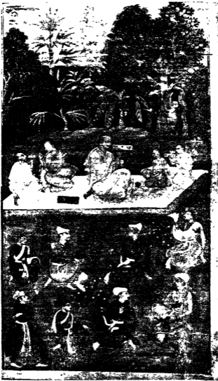
शालिभद्र चौपई का एक सचित्र पृष्ठ